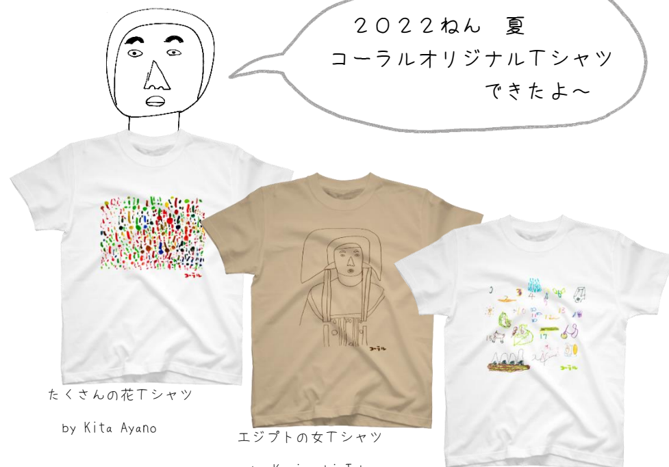
たくさんの花Tシャツ