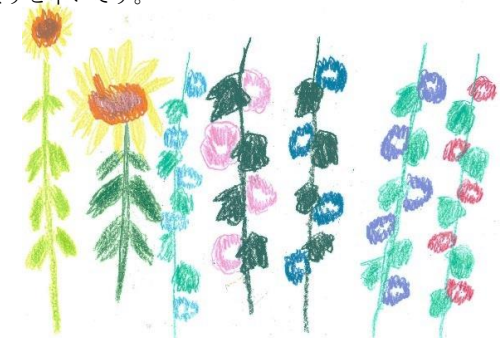
Illustration by Kusaka Takako

『CORAL REEF』はこれから、3ヶ月毎のちょうど季刊のような形で発行していく予定です。季節のお便りのような、そんな気持ちで、どうぞお楽しみいただけますと幸いです。