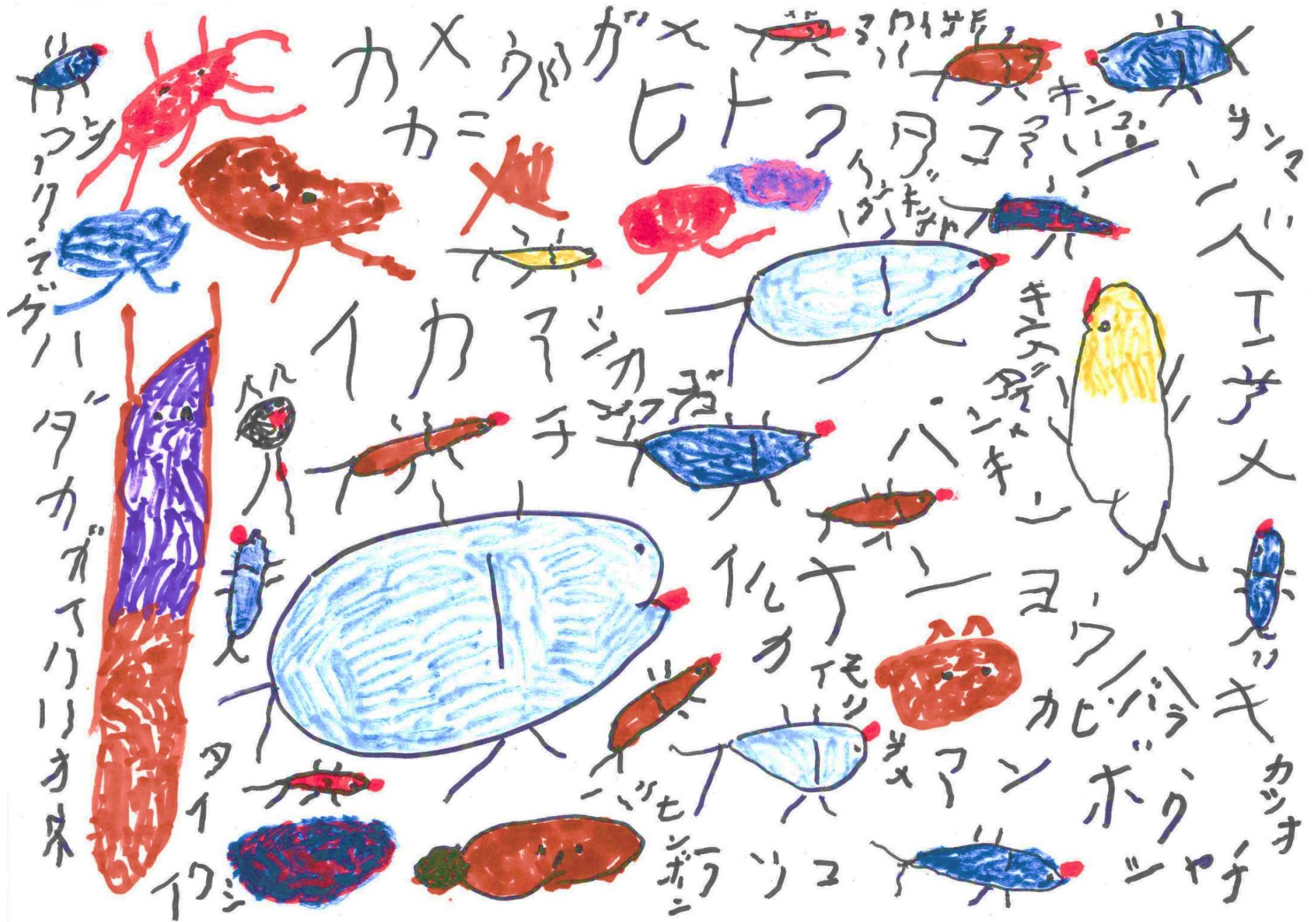
Illustration by Someya Yuko